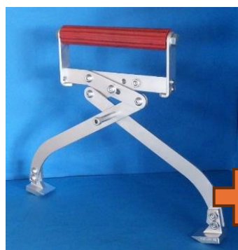
AGT 100 / AGT 200